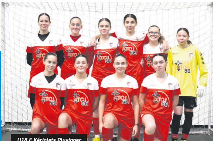
U18 F. Kériolets Pluvigner