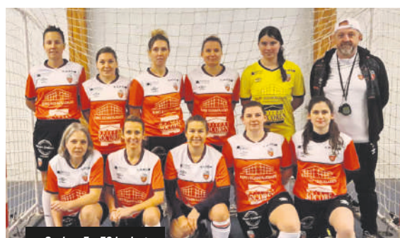
Seniors F - FC Lorient