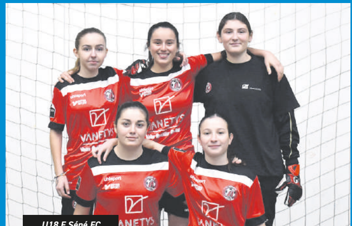
U18 F. Séné FC