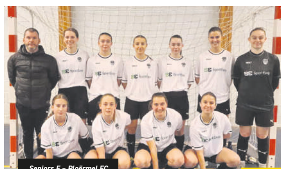
Seniors F - Ploërmel FC