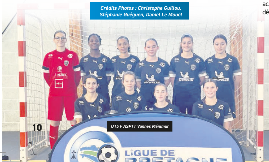
U15 F ASPTT Vannes Ménimur