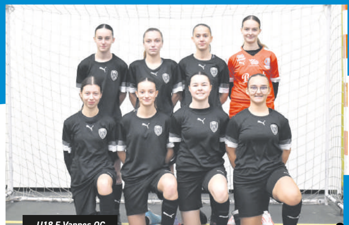
U18 F. Vannes OC