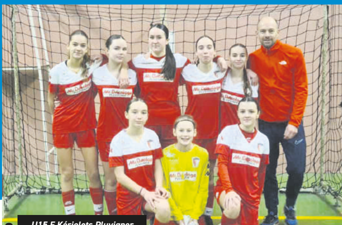
U15 F Kériolets Pluvigner