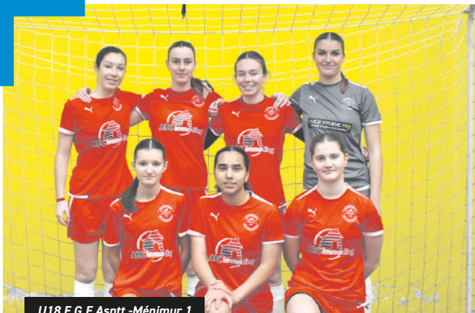
U18 F.G.F. Asptt - Ménimur 1