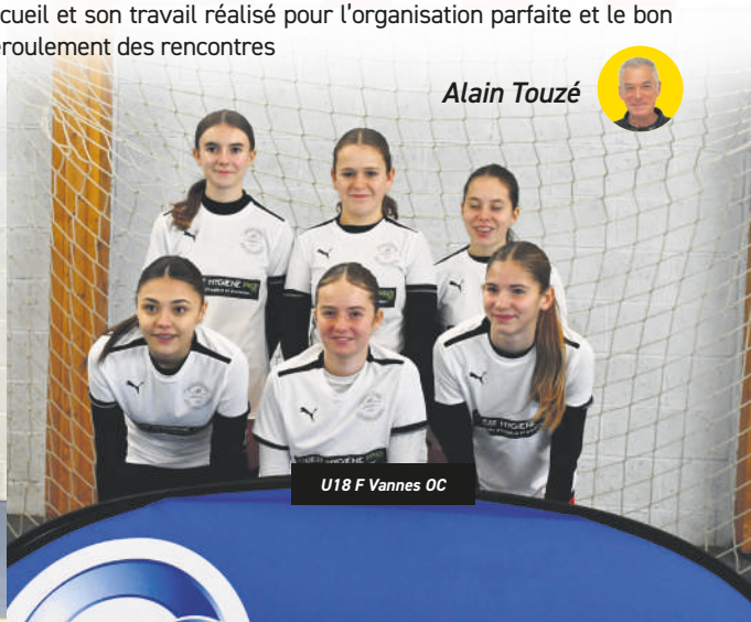
U18 F Vannes OC