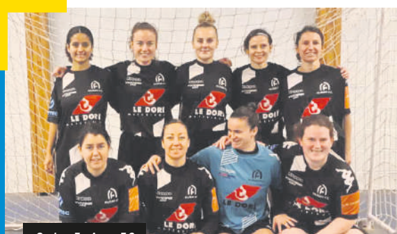
Seniors F - Auray F.C

Les équipes seniors F d'Auray FC, Hennebont Futsal, Ploërmel F.C et du FC Lorient se sont rencontrées pour le tour qualificatif pour la demi-finale Régionale. Félicitations au Ploërmel F.C pour sa qualification.