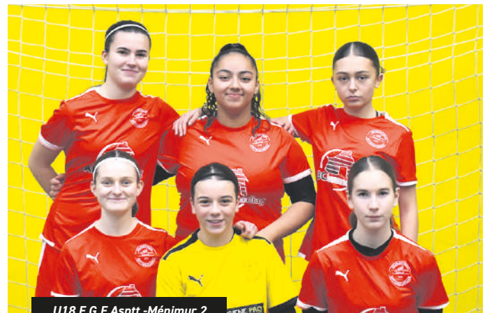
U18 F.G.F. Asptt - Ménimur 2