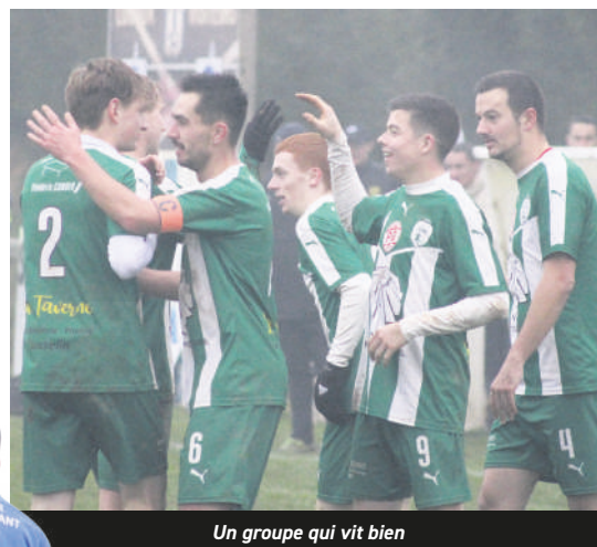
Un groupe qui vit bien