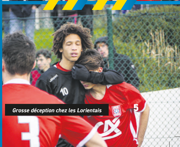
Grosse déception chez les Lorientais