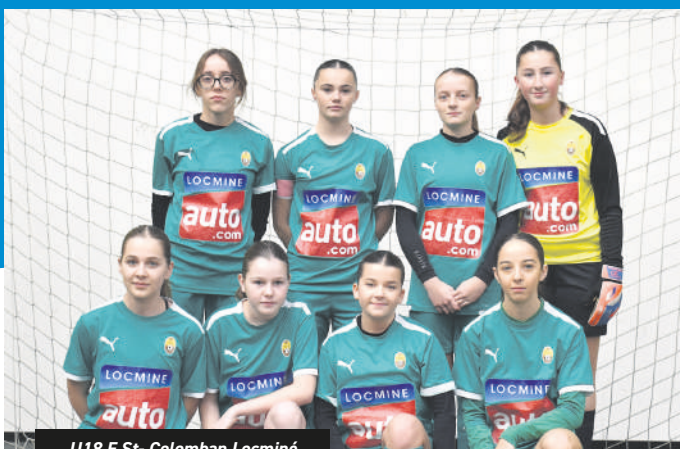
U18 F. St-Colomban Locminé