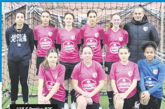
U15 F Pontivy P2F