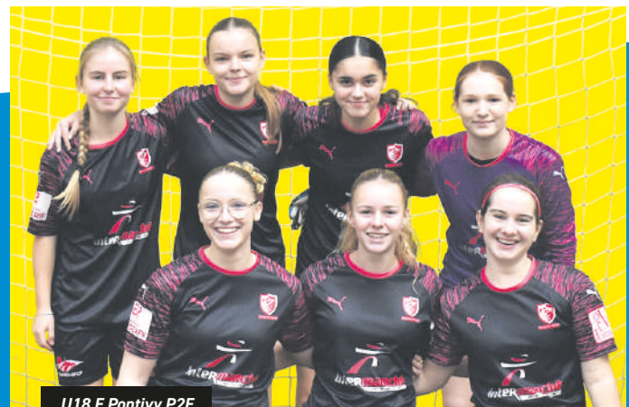
U18 F. Pontivy P2F