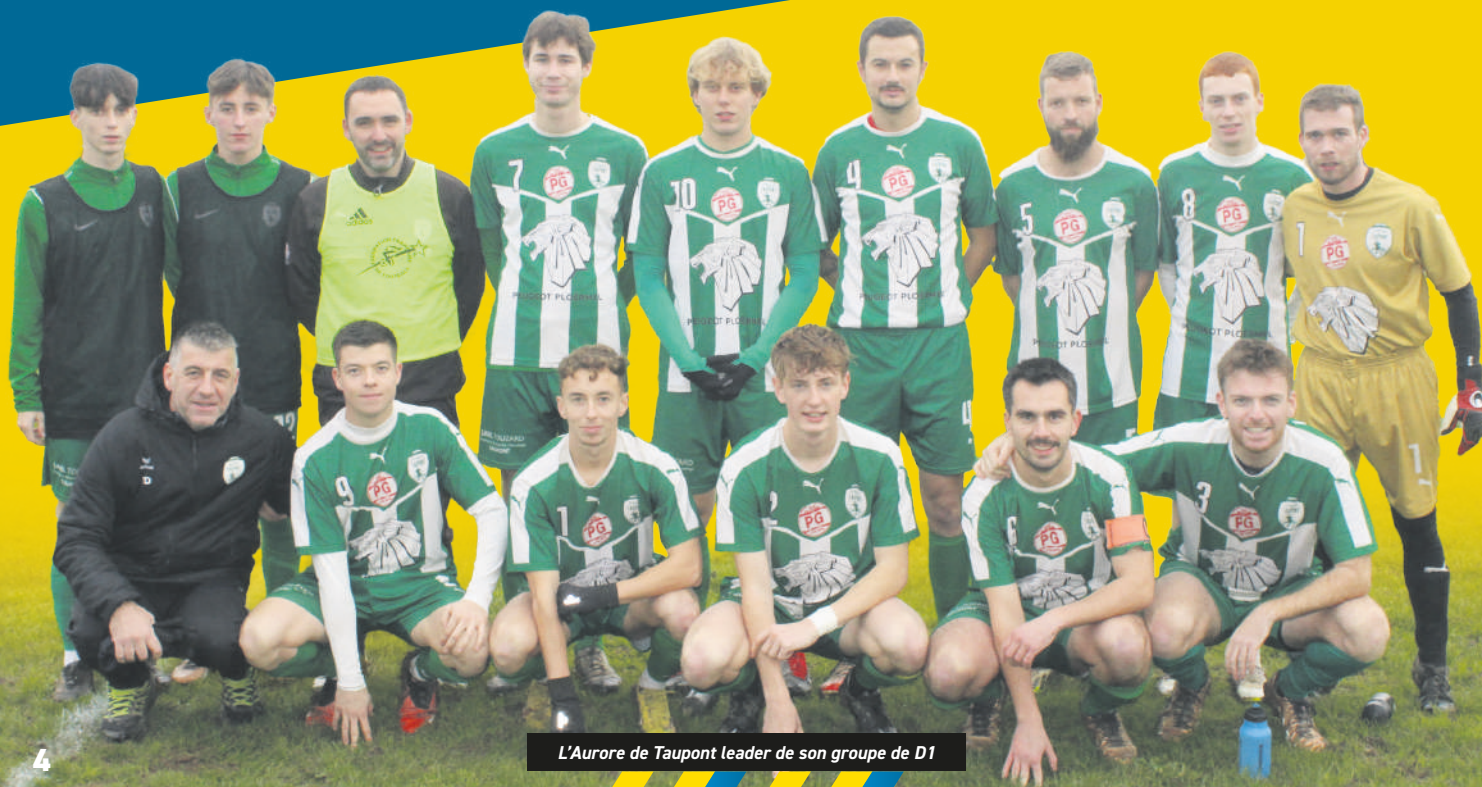
L'Aurore de Taupont leader de son groupe de D1