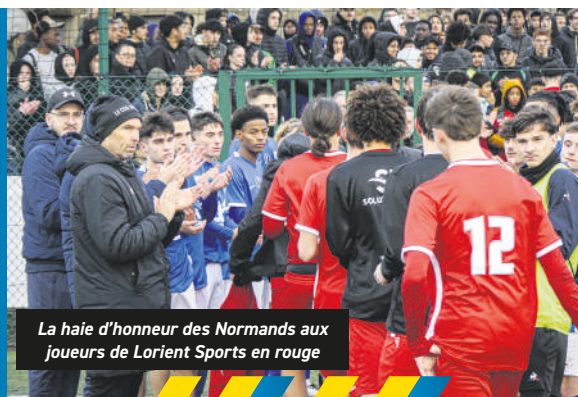
La haie d'honneur des Normands aux joueurs de Lorient Sports en rouge

Guichen FC (R2) - Lorient Sports : 0-0 (tab 4-5)