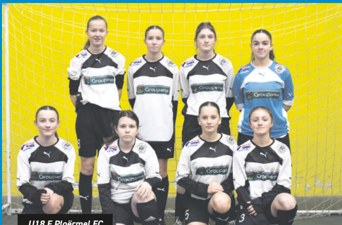
U18 F. Ploërmel FC