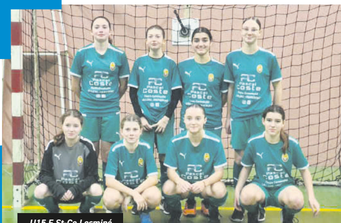
U15 F St-Co Locminé