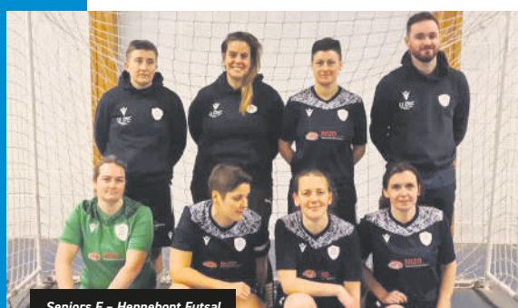
Seniors F - Hennebont Futsal