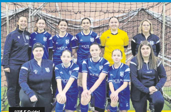
U15 F Guidel