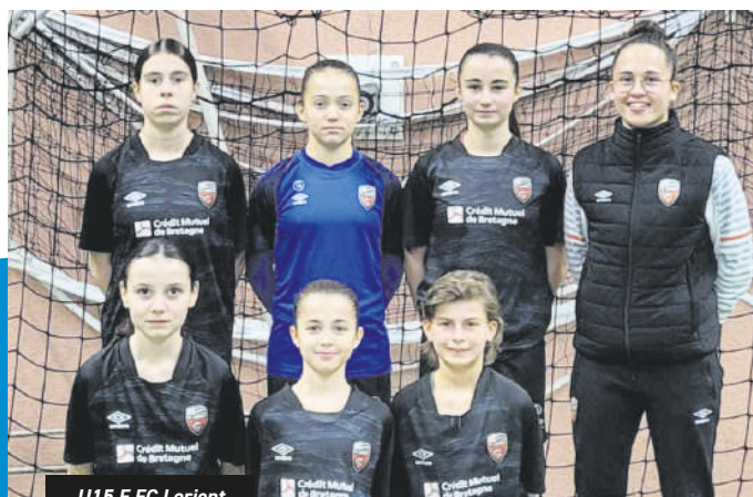
U15 F FC Lorient