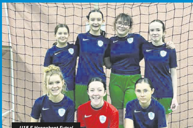
U15 F Hennebont Futsal