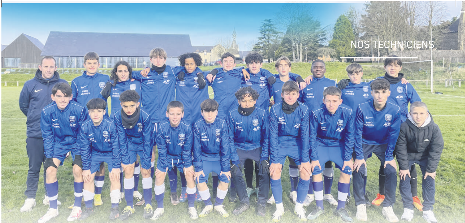
Photo de l'équipe avec leurs nouveaux équipements