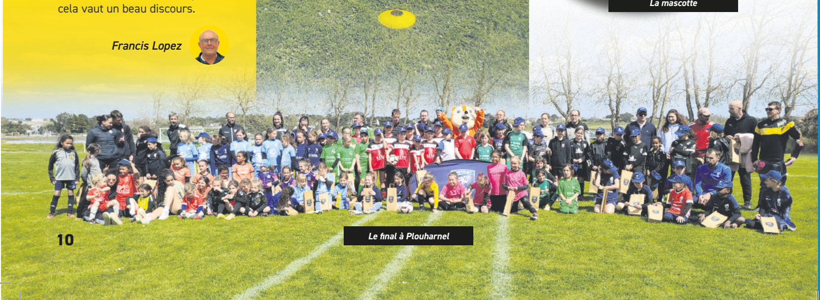
Le final à Plouharnel