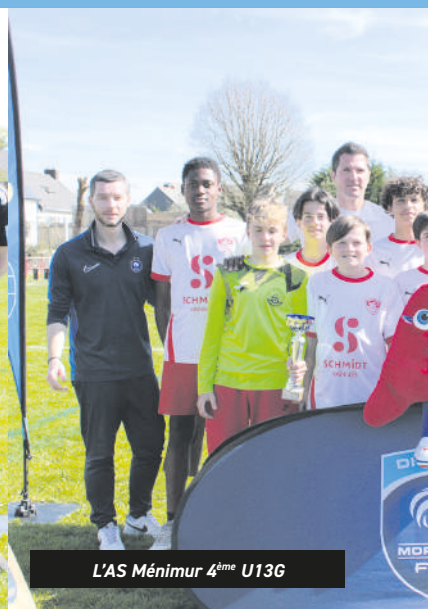
L'AS Ménimur 4 ème U13G