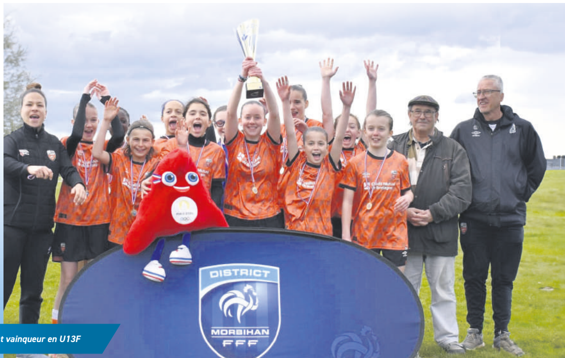
Le FC Lorient vainqueur en U13F