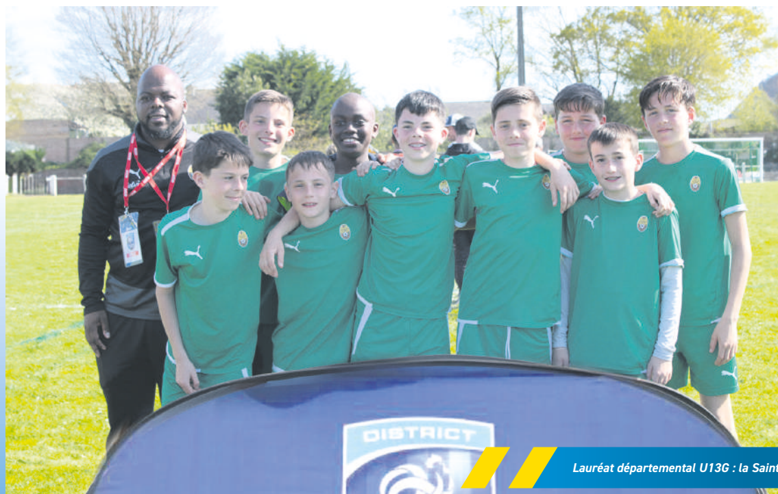
Lauréat départemental U13G : la Saint-Co Locminé

C'est l'un des moments forts de la saison footballistique. Ces deux dernières semaines se sont déroulées les finales départementales du Festival Pitch U13F et U13G accompagnées par la mascotte des Jeux Olympiques, Phryge.