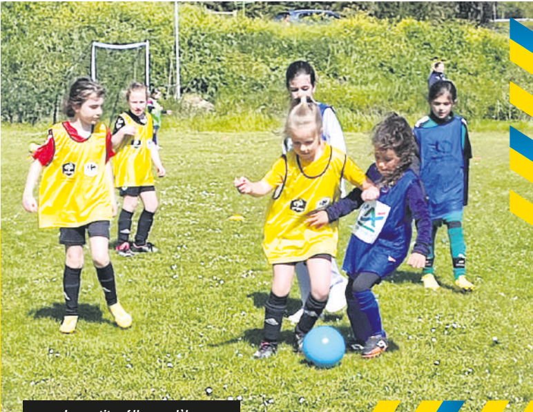
Les petites filles modèles