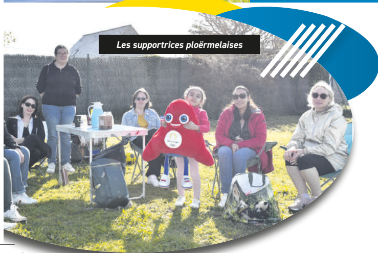
Les supportrices ploërmelaises