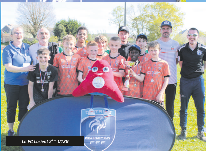
Le FC Lorient 2 ème U13G

• U13G : AS Ménimur, BO Questembert, CS Quéven, Ent Caden Limerzel Pluhérin, FC Lorient, GJ BRO Rohan, GJ Pays de la Roche Bernard, GJ Pays de Malesroit, GJ Pays de Sulinac, GJ Triskel Crédin, La Guidéloise, Ploërmel FC, Saint-Co Locminé, Stade Hennebontais, US Brech, US Montagnarde.