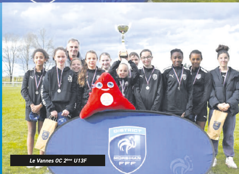
Le Vannes OC 2 ème U13F