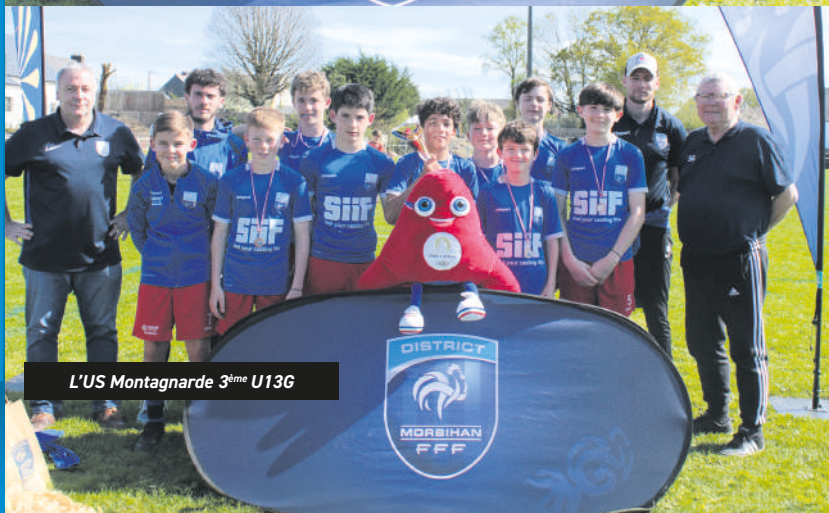
L'US Montagnarde 3 ème U13G