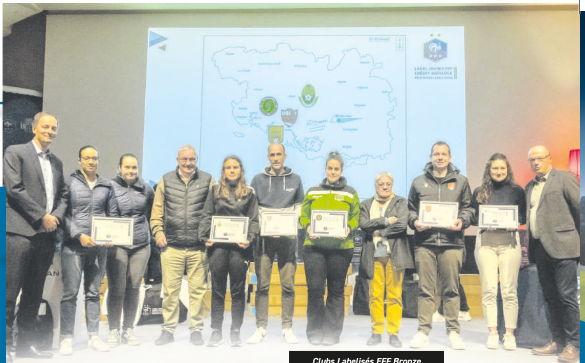
Clubs Labélisés EFF Bronze