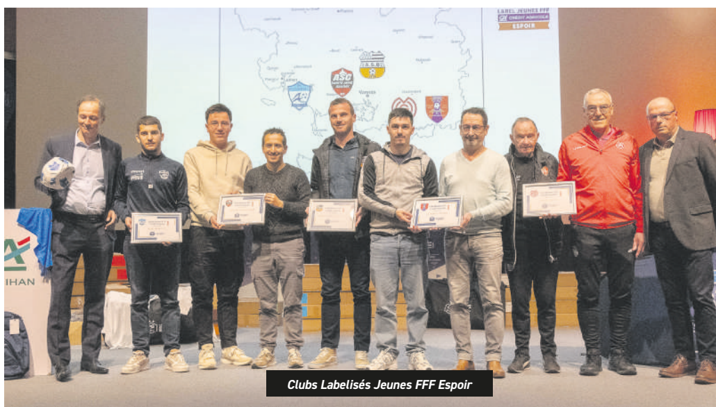
Clubs Labellisés Jeunes FFF Espoir