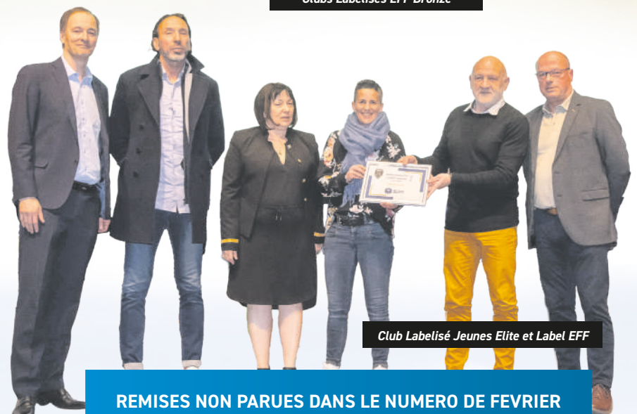
Club Labélisé Jeunes Elite et Label EFF