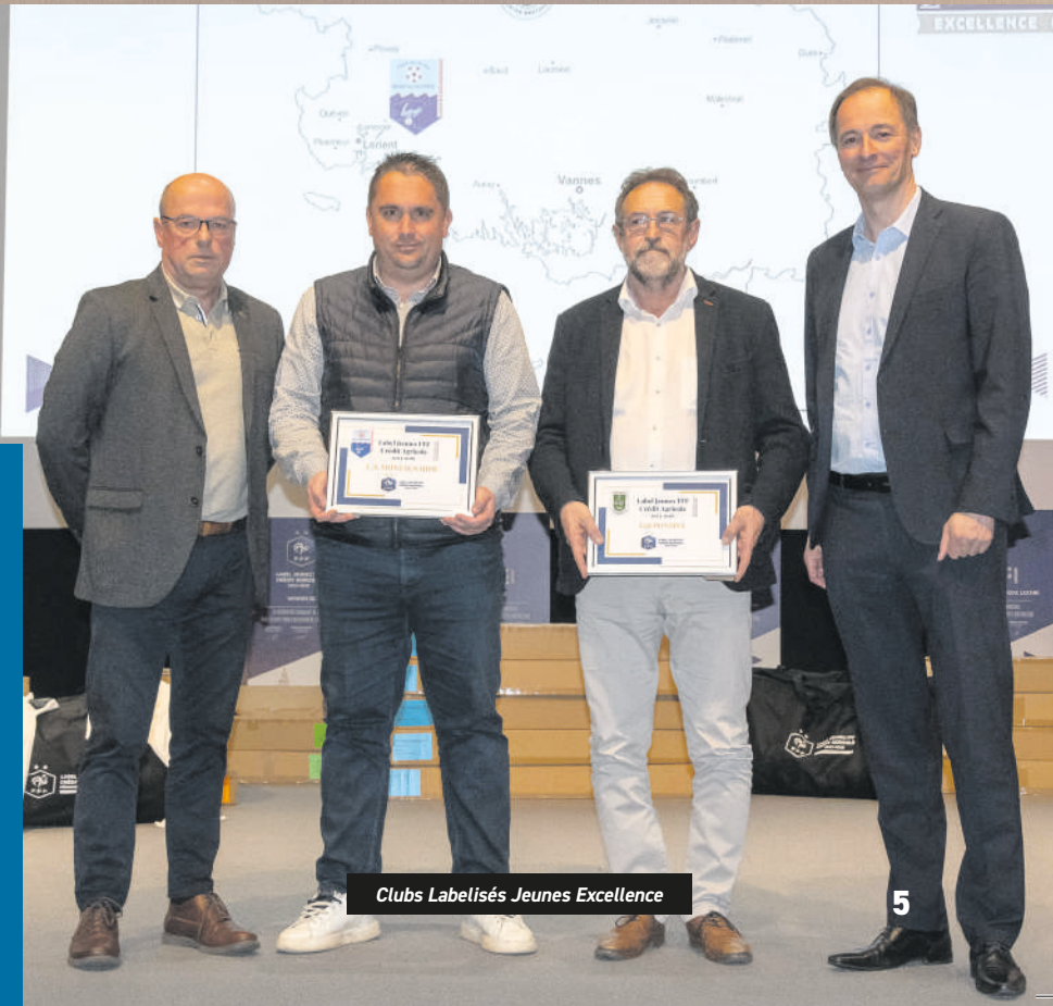
Clubs Labellisés Jeunes Excellence