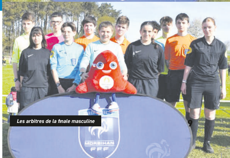
Les arbitres de la finale masculine