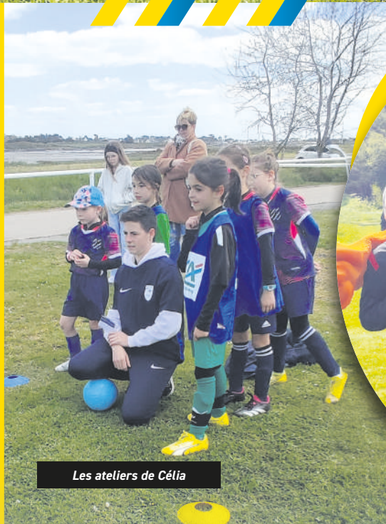
Les ateliers de Célia