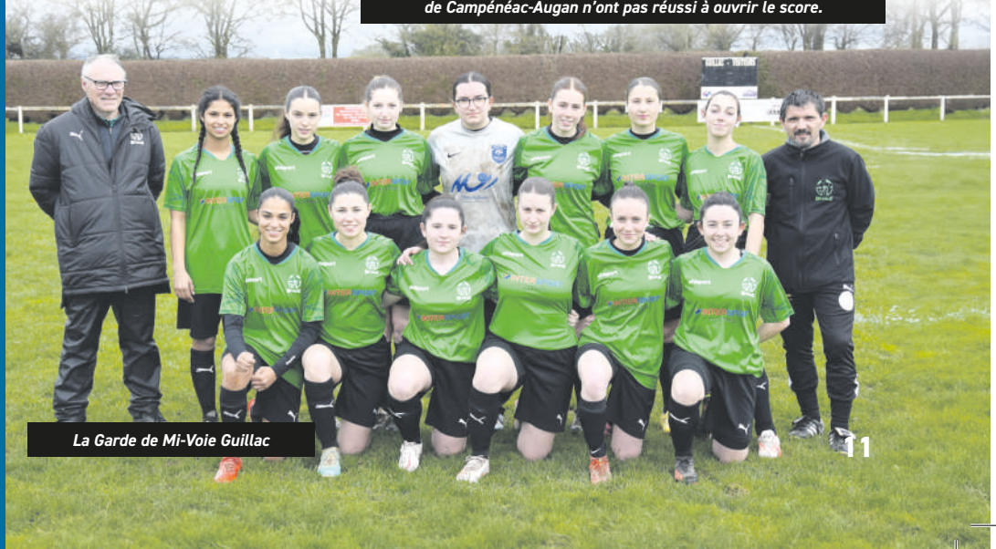
La Garde de Mi-Voie Guillac